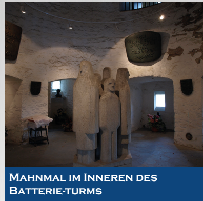
MAHNMAL IM INNEREN DES BATTERIE-TURMS

Deutsche Vertriebenenverbände bestehen seit 1949, nachdem die Besatzungsmächte das Vereinsverbot für Vertriebene aufgehoben hatten. Dem Bundesverband gehören heute 16 Landesverbände und 21 Landsmannschaften an. Im Landesverband NRW sind 50 Kreisverbände und 10 Landsmannschaften organisiert: Bund der Danziger, Deutsch-Baltische Landsmannschaft, Landsmannschaft der Deutschen aus Russland, Landsmannschaft der Oberschlesier, Landsmannschaft Ostpreußen, Landsmannschaft der Siebenbürger Sachsen, Landsmannschaft Schlesien-Nieder- und Oberschlesien, Pommersche Landsmannschaft, Sudetendeutsche Landsmannschaft, Westpreussische Gesellschaft.