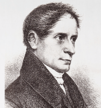
JOSEPH VON EICHENDORFF

In § 96 des Bundes- und Vertriebenen und Flüchtlingsgesetz heißt es u. a.: „Bund und Länder haben entsprechend ihrer durch das Gesetz gegebenen Zuständigkeit das Kulturgut der Vertreibungsgebiete in dem Bewusstsein der Vertriebenen und Flüchtlinge, des gesamten deutschen Volkes und des Auslandes zu erhalten.“