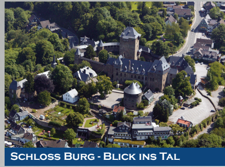
SCHLOSS BURG - BLICK INS TAL

Der Batterieturm auf Schloss Burg beherbergt die Gedenkstätte des Deutschen Ostens, die einzige zentrale Erinnerungsstätte für deutsche Heimatvertriebene, Aussiedler und Spätaussiedler in Nordrhein-Westfalen.